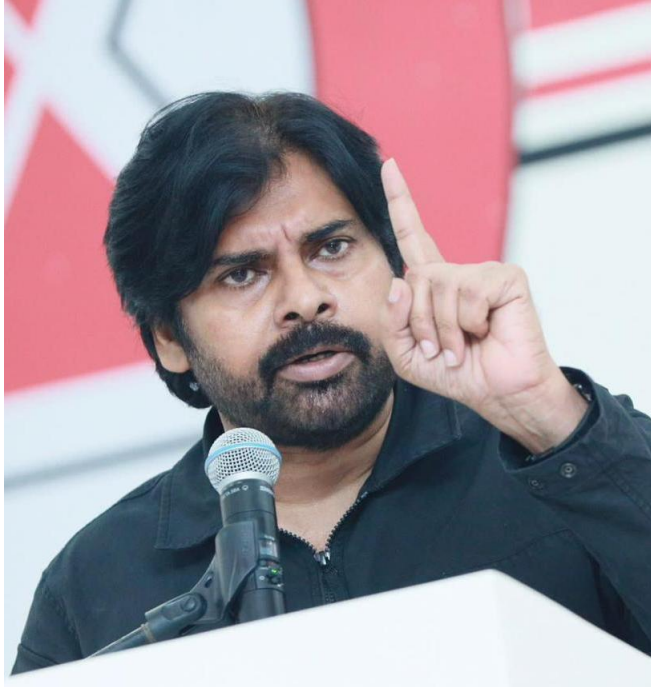
ప్రతిపక్షాల కూటమిని తక్కువ అంచనా వేయకూడదన్నారు. అలాగే వైసీపీని తక్కువ అంచనా వేయకూడదు. రాష్ట్రానికి పట్టిన చీడ, పీడ ఆ పార్టీ. మనందరం కలిసి ఆ చీడను తొలగించాలన్నారు

మరో ఆరు నెలల్లో ప్రభుత్వం మారబోతోంది. వైసీపీ పోయి... బీజేపీ ఆశీస్సులతో జనసేన, తెలుగుదేశం ప్రభుత్వం రాబోతుందని జనసేన పార్టీ అధ్యక్షులు పవన్ కళ్యాణ్ పేర్కొన్నారు. జగన్ పాలనకు చరమాకం పాడాలి... ఆంధ్ర పదేశ రాష్ట్రాన్ని జగన్ చెర నుంచి విముక్తి చేయాలనే బలమైన సంకల్పంతో రాజమండ్రిలో ప్రత్యేక పరిస్థితుల్లో పొత్తుల నిర్ణయం తీసుకున్నారని తెలిపారు. నా నిర్ణయానికి పార్టీ నాయకులు మద్దతు తెలపడం చాలా ఆనందం కలిగించిందని చెప్పారు. స్వార్థానికి పోకుండా, రాష్ట్ర భవిష్యత్తును దృష్టిలో పెట్టుకొని మీరు తీసుకున్న నిర్ణయం చాలా ఆనందం కలిగించిందని తటస్థ ఓటర్లు మెసెజ్ లు చేయడం సంతోషాన్ని ఇచ్చిందని పేర్కొన్నారు. మంగళగిరి పార్టీ కార్యాలయంలో శనివారం పార్టీ విస్తృతస్థాయి సమావేశం నిర్వహించారు. ఈ సందర్భంగా శ్రీ పవన్ కళ్యాణ్ గారు మాట్లాడుతూ “మాజీ ముఖ్యమంత్రిని అరెస్టు చేసే పరిస్థితులు రాష్ట్రంలో నెలకొన్నాయంటే అది సంతోషించి విషయం కాదన్నారు. కుత్సితమైన మనస్తత్వం ఉన్న వాళ్లు మాత్రమే ఆనందపడతారు. ప్రత్యర్థి పార్టీ బలహీనపడితే ఎవరికైనా ఆనందంగానే ఉంటుందన్నారు. అయితే అది మనకు మేలు చేస్తుంది.. తర్వాత మనమే అధికారంలోకి వస్తామని గ్యారెంటీ ఏంటి? మళ్లీ జగన్ ముఖ్యమంత్రి అయితే ఈ రాష్ట్రం, ప్రజలు భరించగలరా? వైసీపీ, జగన్ బలాన్ని తక్కువ అంచనా వేయకూడదు. దాని బలం దానికంది. పవన్ కళ్యాణ్ కు వ్యక్తిగతంగా బలం ఉందన్నారు. రాష్ట్రంలో ఏ మూలకు వెళ్లిన లక్షలాది జనాలు తరలివస్తారు. అందులో ఎలాంటి సందేహం లేదు. అయితే అది ఎన్నికల్లో గెలవడానికి సరిపోదన్నారు. జనసేనకు బలమైన నాయకత్వపు సమూహాలు కావాలి. ఆ ప్రయత్నంలోనే మనం ఉన్నామన్నారు. .